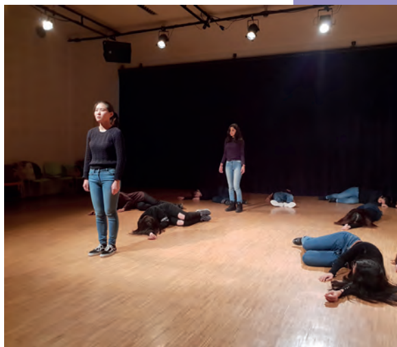
^ Spectacle Lettres chinoises, adapté et interprété par les étudiants en DU ASCIE