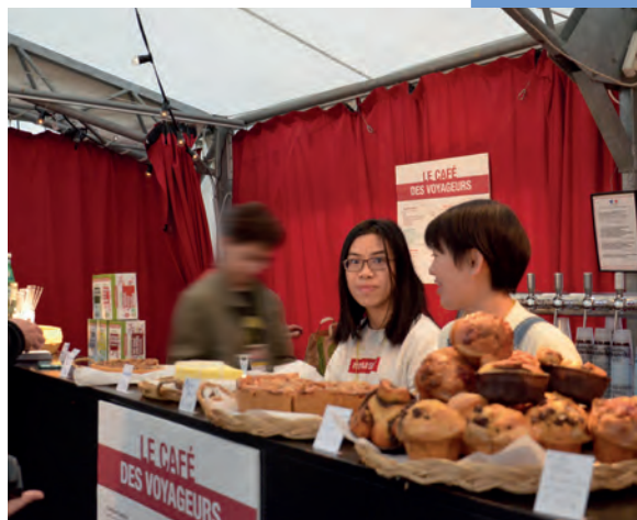
^ Participation bénévole au Festival Quais du Département consacré aux films et livres de voyage