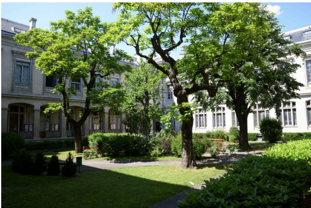
Campus Berges du Rhône Université Lumière Lyon 2