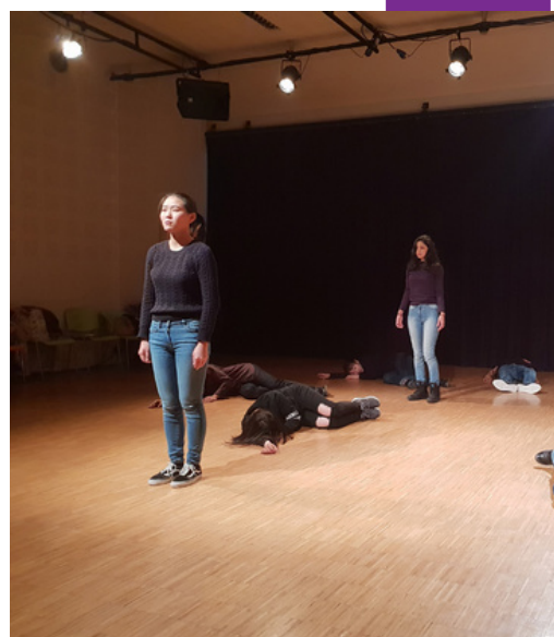
Spectacle Lettres chinoises, adapté et interprété par les étudiants du CIEF

Pour plus d'informations, consultez notre site web : https://cief.univ-lyon2.fr/