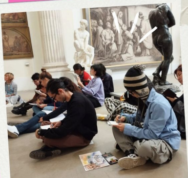
Atelier dessin au musée des Beaux-Arts