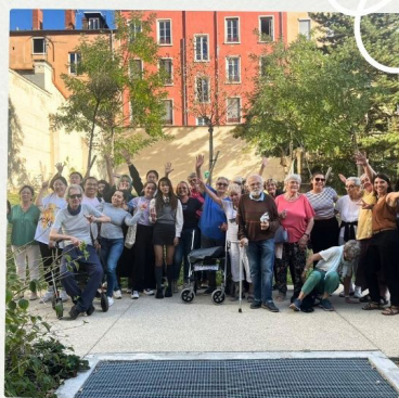
Après-midi au Café Chez Daddy