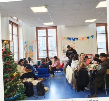
Atelier de lecture en salle d'animation