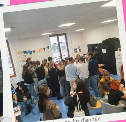
Goûter de fin d'année