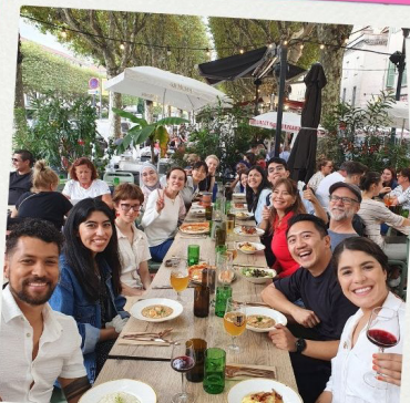
Sortie à Vienne et Tain-l'Hermitage