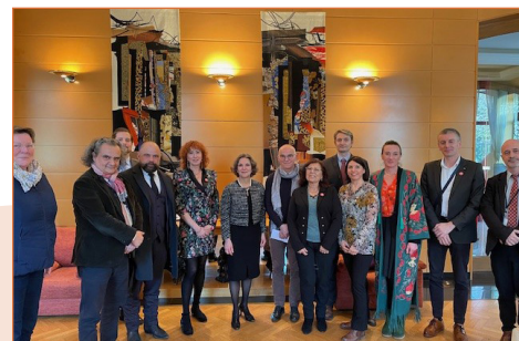
La délégation française en Ouzbékistan

Le Consortium a prévu une nouvelle mission en juin 2024 afin d'avancer sur ce projet qui pourrait démarrer dès octobre 2024.